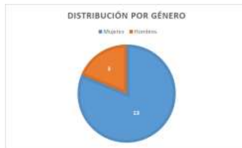
Cuadro No. 5. Distribución por género.

Las entrevistas fueron aplicadas a 16 personas mayores de dieciocho años, principalmente mujeres, (3 hombres y 13 mujeres) en la ciudad de Cuernavaca (Estado de Morelos, México), teniendo en cuenta que la ubicación geográfica de la universidad donde se realiza esta investigación. Las características o datos homogéneos, como se expresó en párrafos anteriores: no tener empleo formal. no cotizantes al Ley del Ley del Seguro Social, que se dedican a las tareas domésticas y conviven en pareja o con familiares con vínculos de parentesco y dedican más de la mitad de la jornada diaria a las tareas de asistencia, mantenimiento o cuidado en el contexto familiar, en la fecha en que se aplicó la encuesta, la cual fue entre el 15 de mayo y el 15 de junio de 2024.