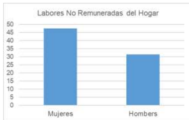
Cuadro 2. De elaboración propia.

a la economía a través del trabajo y de la tributación, en especial, aquellos últimos puesto que son la fuente principal del financiamiento, entre otros rubros, las pensiones no contributivas.