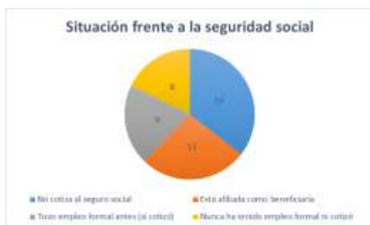
Cuadro No. 6. Situación Seguridad Social. Elaboración propia

Se destacan, principalmente, datos como: las actividades diarias y recurrentes que realizan en el hogar y al servicio de sus familiares, su dependencia económica a un familiar económicamente activo, la ausencia de cotización a un régimen de seguridad social y la vinculación a un empleo formal.