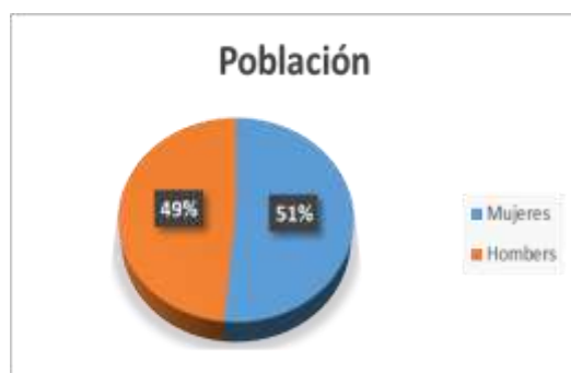
Cuadro No.3. De elaboración propia.

población, el 23% eran menores de 14 años, los de 15 a 29 representaron el 24%, el 43% se encontraba entre los 30 y 64 años de edad y los mayores de 65 fueron el 10%. 314 Por último, de acuerdo con los datos de la Secretaría General del Consejo Nacional de Población del 2023, las mexicanas y los mexicanos tienen una esperanza de vida al nacer de 78.6 años ellas y de 72.3 ellos. 315