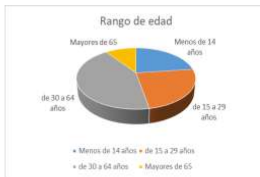
Cuadro No.4. De elaboración propia.

Con relación a las cifras de la población descrita, México presenta un aumento escalonado del envejecimiento en virtud de que, la edad promedio en 1970 fue de 16 años y en el 2023 ascendió a 30. Ahora, se prevé que en un periodo de 5 décadas aumente en 18 años, es decir que en el 2070 la media podría ser de 48 años. 316