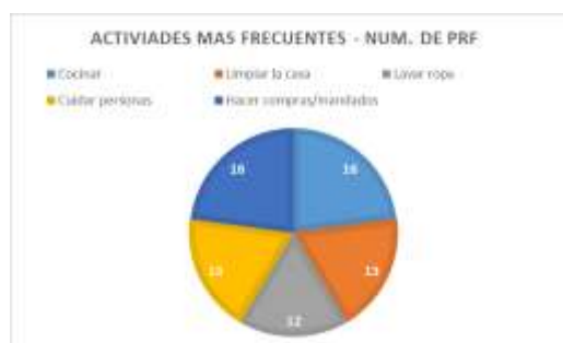
Cuadro No. 7. Actividades frecuentes Elaboración propia

Del resultado de las entrevistas, se resalta que la mayoría de las labores no remuneradas del hogar son realizadas por el género femenino que a la fecha ni cotizan ni están afiliadas a un régimen de Ley del Seguro Social. Adicionalmente, entre las principales actividades se destacan: Cocinar, cuidar de personas, limpiar la casa, hacer compras relacionadas con el consumo para el hogar y lavar la ropa.