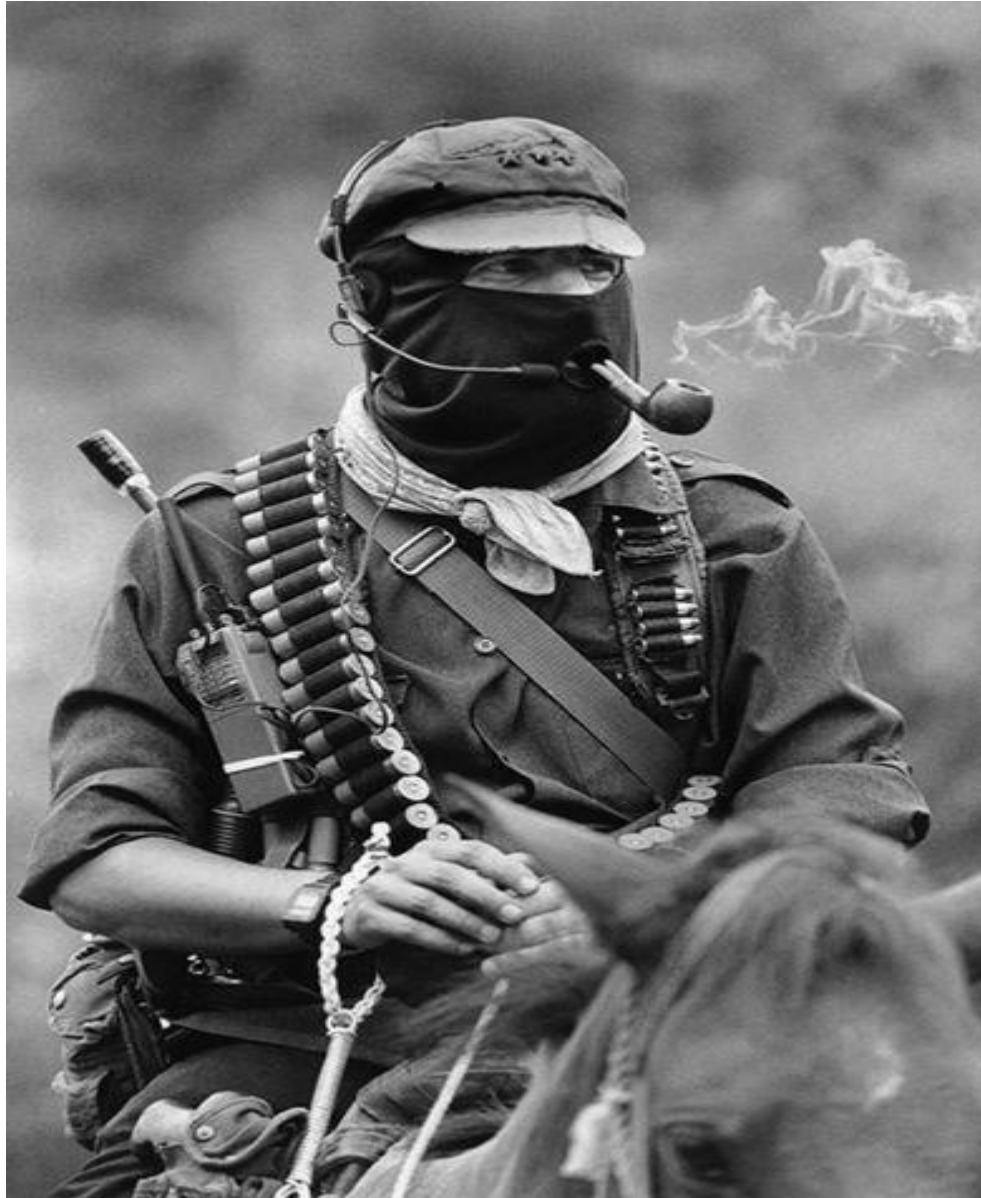
Fotografía N.1: Subcomandante Marcos, como se le acostumbraba ver, a caballo, con su gorra y pasamontañas, pipa y uniforme militar, con las características físicas de un hombre fuerte y misterioso, con sus radios para poder comunicarse con los demás guerrilleros y sus balas para estar al frente de batalla.