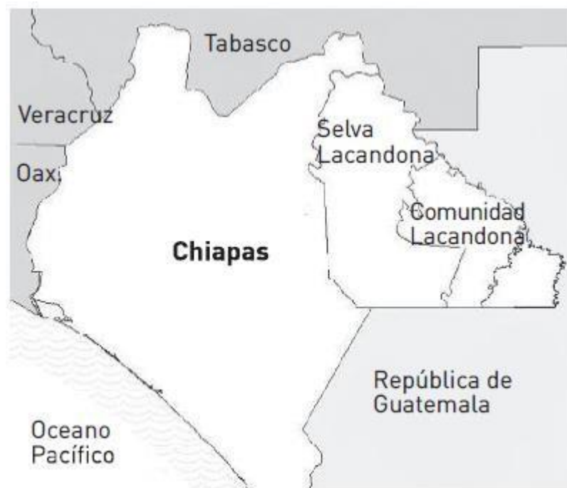
Ubicación de la Selva Lacandona y de la Comunidad Lacandona en el estado de Chiapas.

chiapaneco se puede observar que este problema agrario se venía gestando durante todo el siglo XX. A diferencia de los estados en donde al término de la Revolución mexicana se encaró al asunto agrario, como es el caso de Morelos, en Chiapas la situación fue distinta, pues el reparto de tierras fue más fragmentario e inacabado y existían aún terratenientes que ejercían ciertos privilegios, dejando a mucha de las comunidades indígenas bajo la opresión, la pobreza y al abandono. Esta situación condujo a que muchos indígenas de las distintas etnias del estado empezaran a migrar hacia la Selva Lacandona.