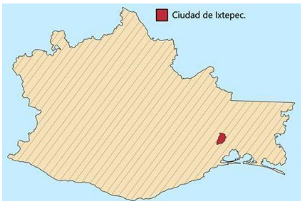
Ilustración 1: Mapa de ubicación de la Ciudad de Ixtepec Oaxaca. .

que los integrantes de este batallón, o al menos los entrevistados que se presentaran a continuación son originarios del estado de Oaxaca.