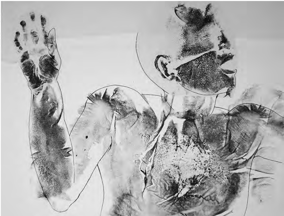
Cautivo , 1991 Impresión corporal y collage 45 x 60 cm