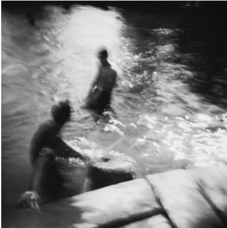
Serie 37°, 2011