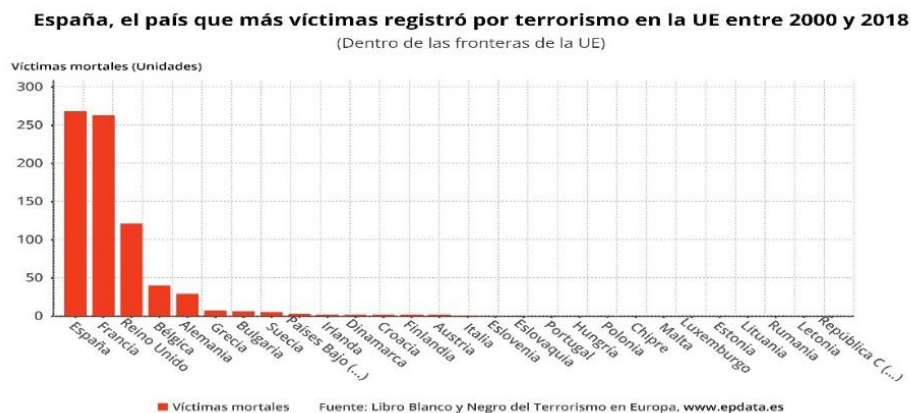
Imagen obtenida de Epdata 105