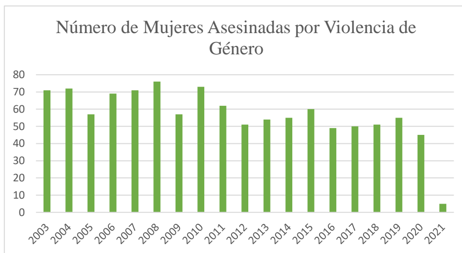
Gráfica 1. Número de Mujeres Asesinadas por Violencia de Género

Fuente: gráfica de elaboración propia con los datos del Portal Estadístico de la Delegación del Gobierno contra la Violencia de Género. 178