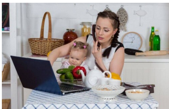
Figura 3. Representación convencional del cuidado familiar “multi-tarea” como un “don femenino” (izquierda) y su análisis con perspectiva de género (derecha).