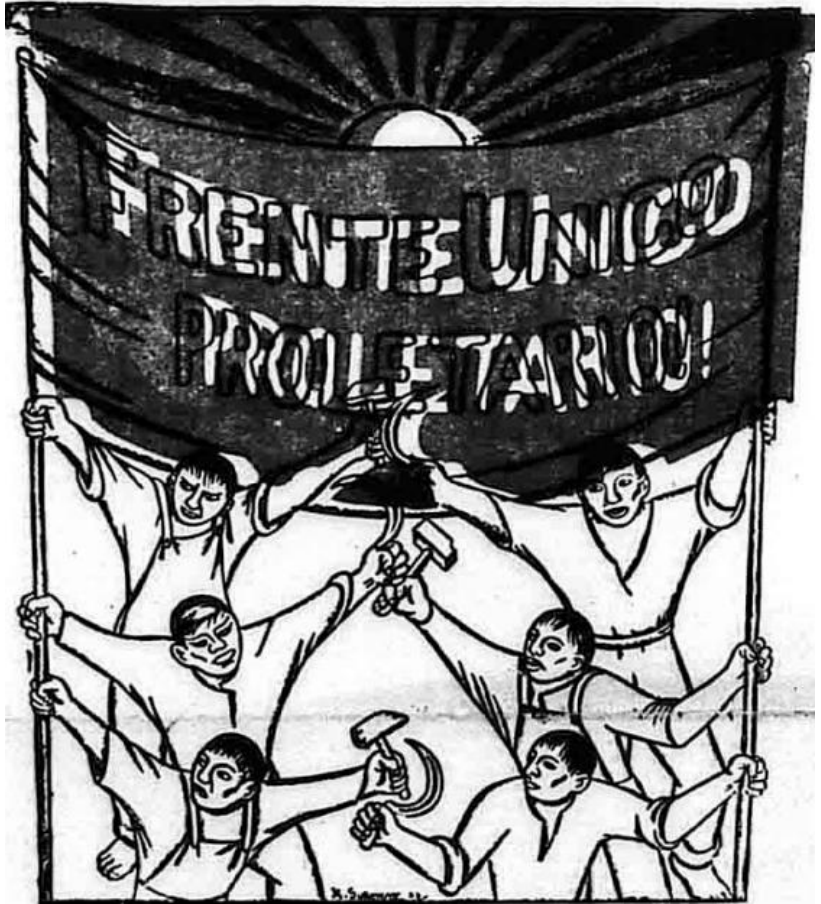
Frente Único Proletario El Machete , núm. 71, julio, 1927, p. 1.