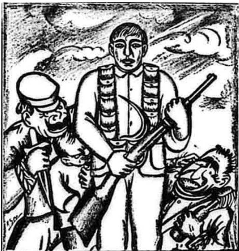
Ante el agrarista armado se estrellará la reacción El Machete , núm. 80, septiembre, 1927, p. 1.